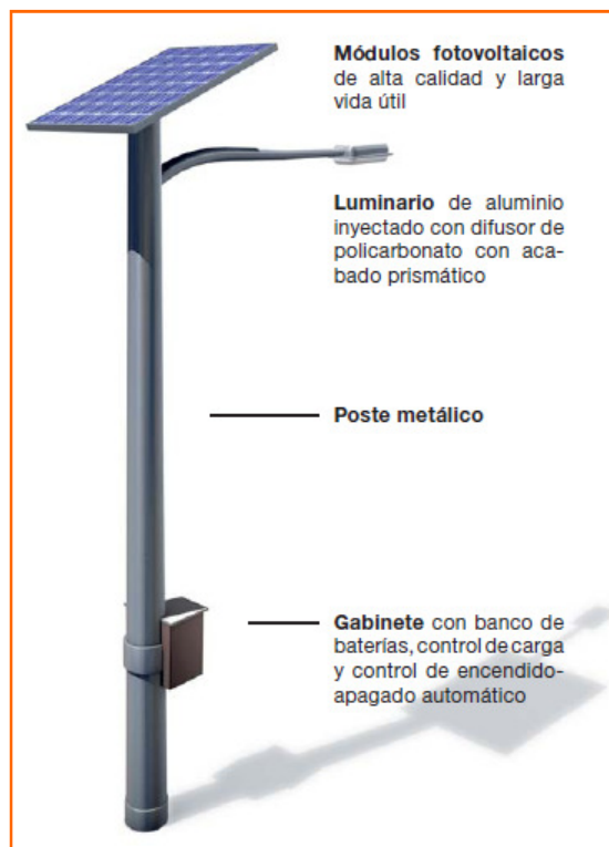
Construcción simple y confiable

La luminaria solar no requiere tendido eléctrico y puede ser instalada en cualquier sitio. No hay restricciones de aplicación ya que opera silenciosamente y es completamente compatible con la ecología del lugar donde se instalan. La operación y el mantenimiento de la luminaria solar se realiza al menor costo posible. No hay pagos por consumo eléctrico y su mantenimiento es casi nulo.